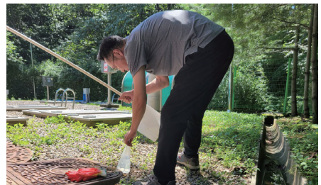
수청 경안 공공하수처리장