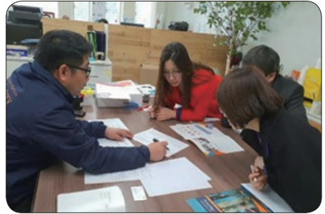
‘18. 3. 기업 현장간담 (안양시 규제개혁팀)