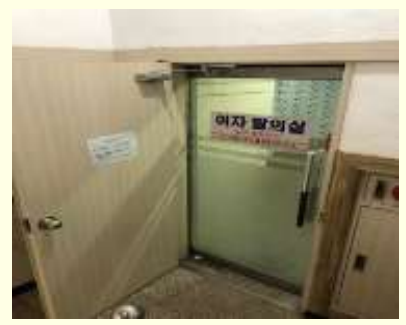
유리문 설치로 파난장애 발생