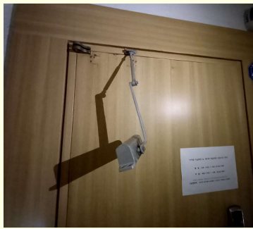
도어클로저 탈거 및 분리