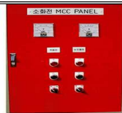
옥내소화전·스프링클러 펌프 등