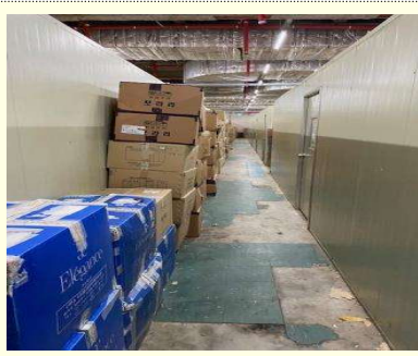
파난통로 상 물건 적치 등