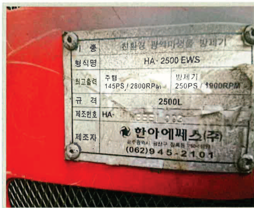
【 대상물건 명판 】