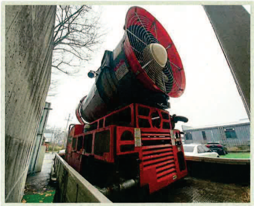
【 대상물건 전경 】