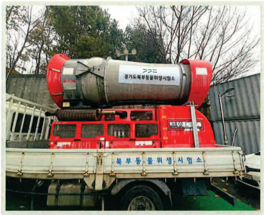
【 대상물건 전경 】