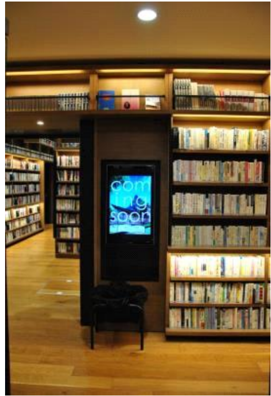
터치 스크린 검색대