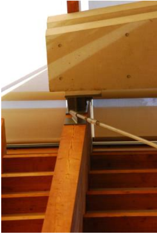
구조 접합부 디테일