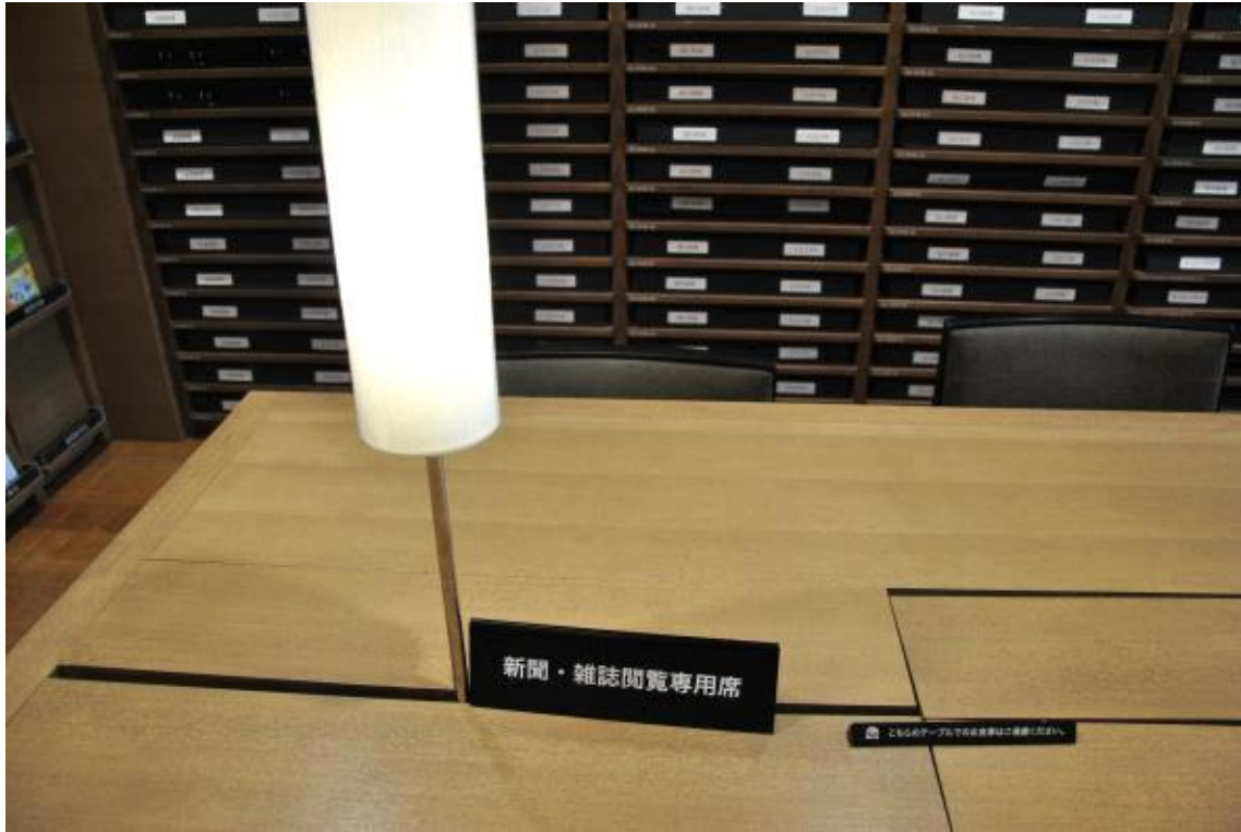
이동이 가능한 스탠드 램프(레일방식)