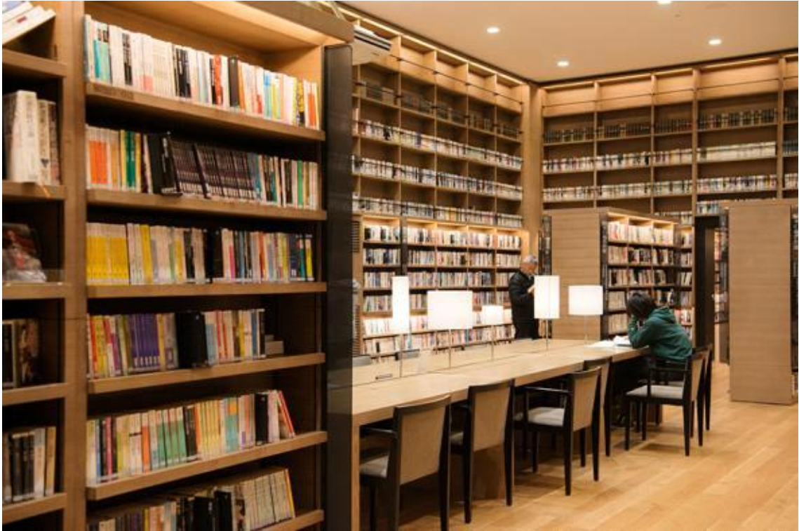
도서관 2층 전경