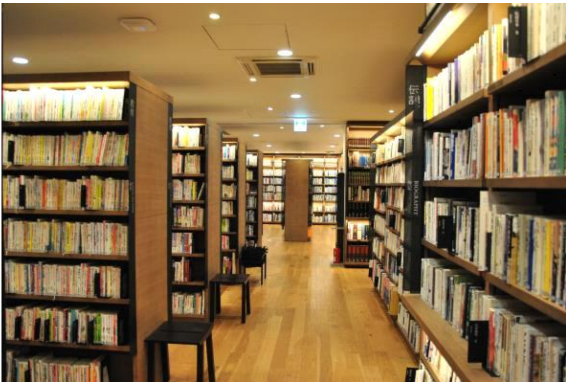
도서관 1층 내부