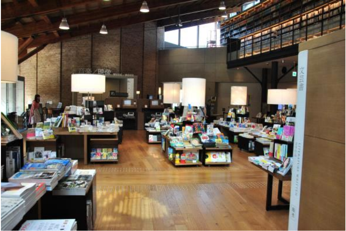
초타야 서점 공간