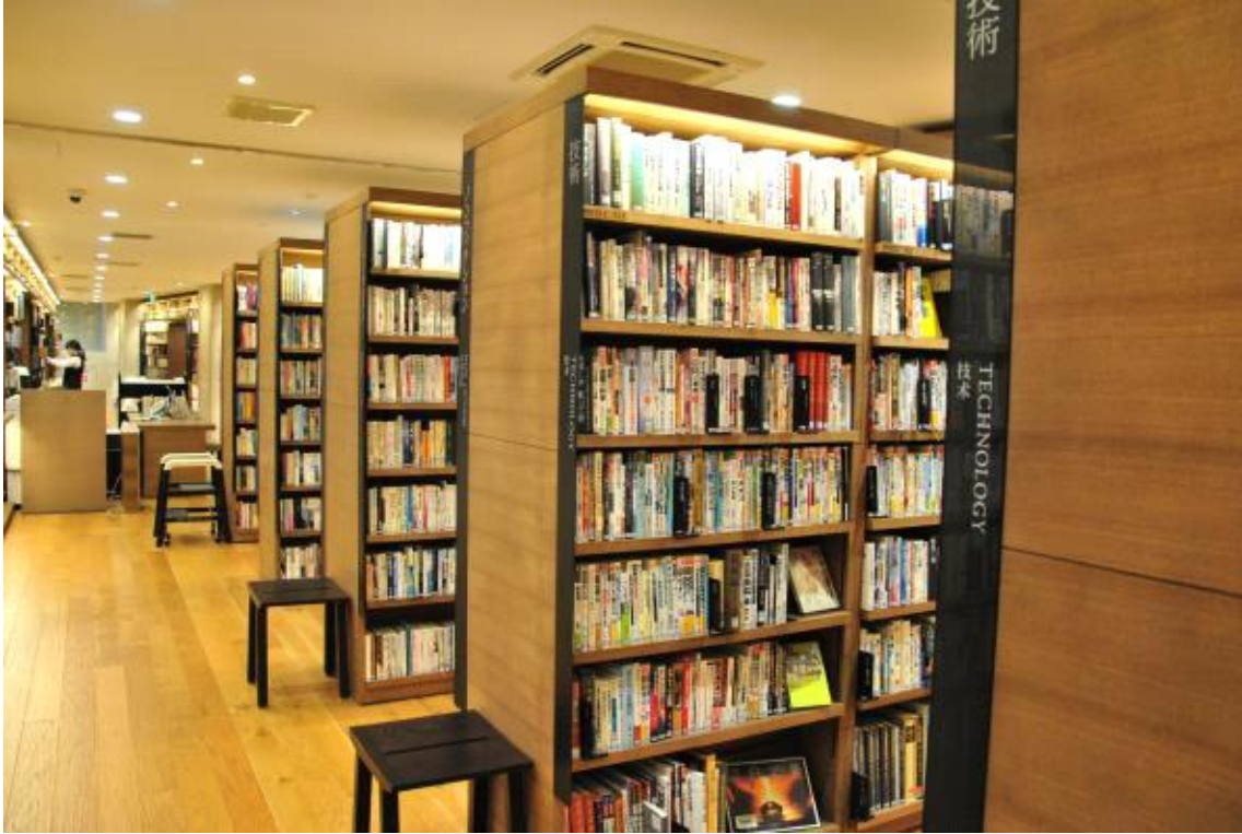
서가 옆 간의의자