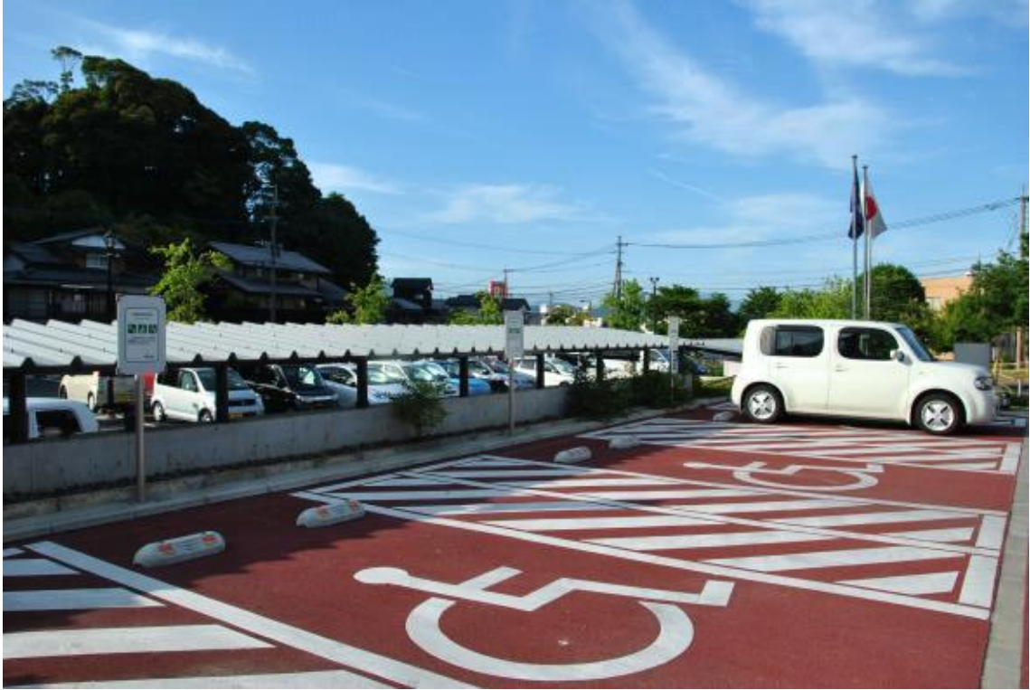
장애인 주차 구역