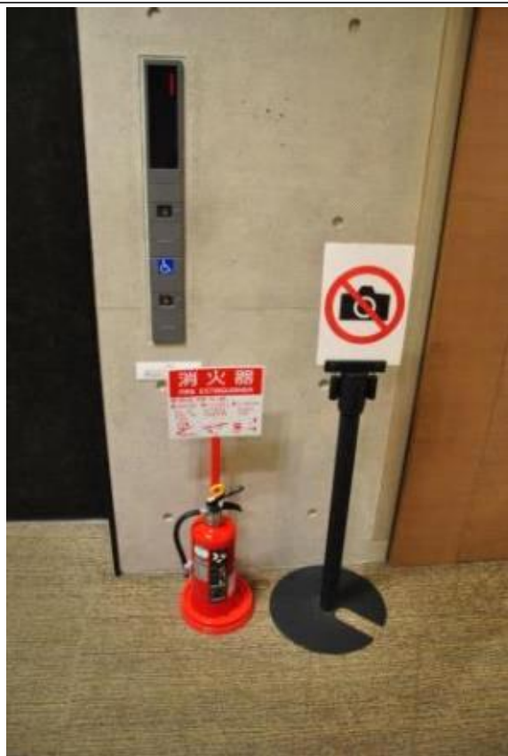
엘리베이터 앞 사인