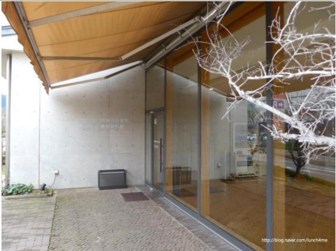
유메타운 쪽 출입구