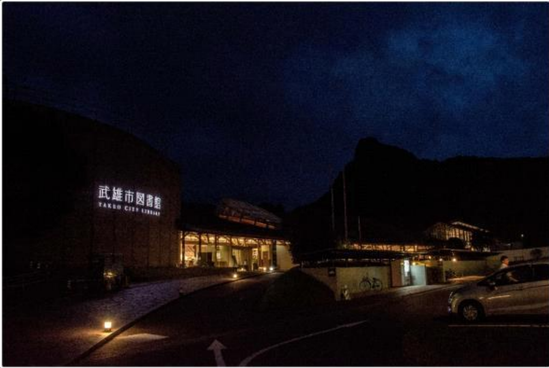
도서관 전경 야간