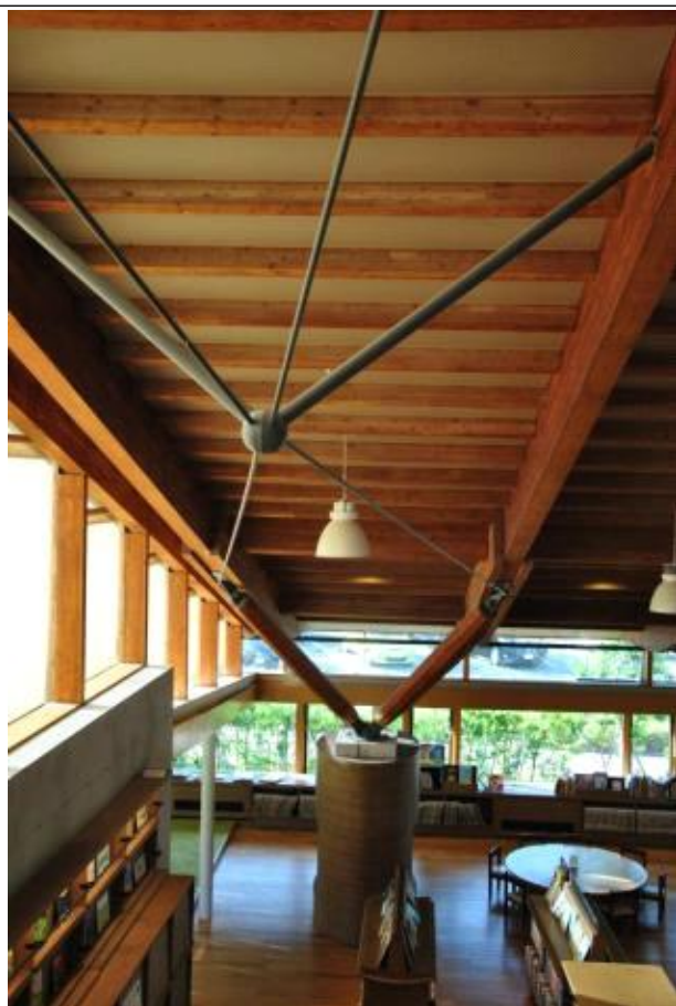
천장을 받치고 있는 구조 형태