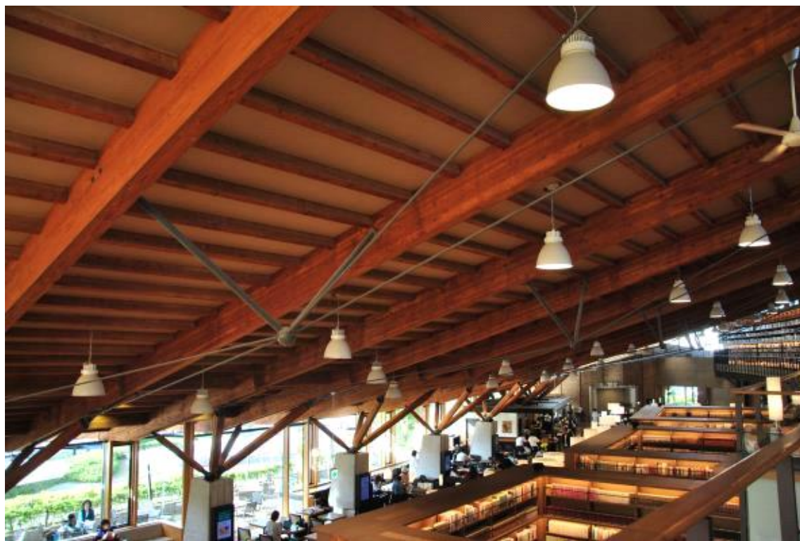
천장 및 램프 구조