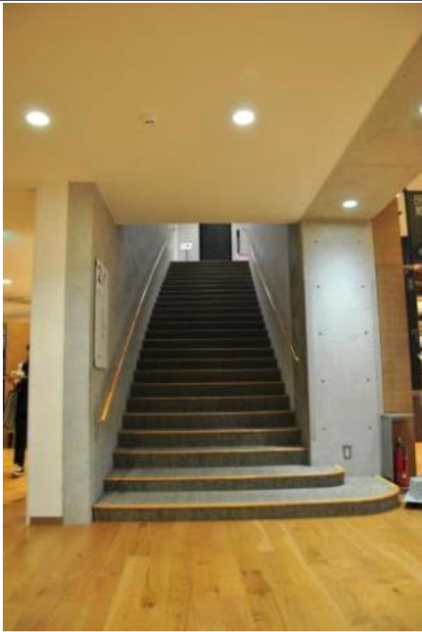
2층 연결 계단