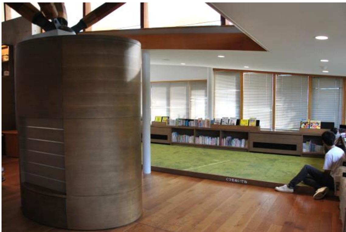
아동 도서 코너