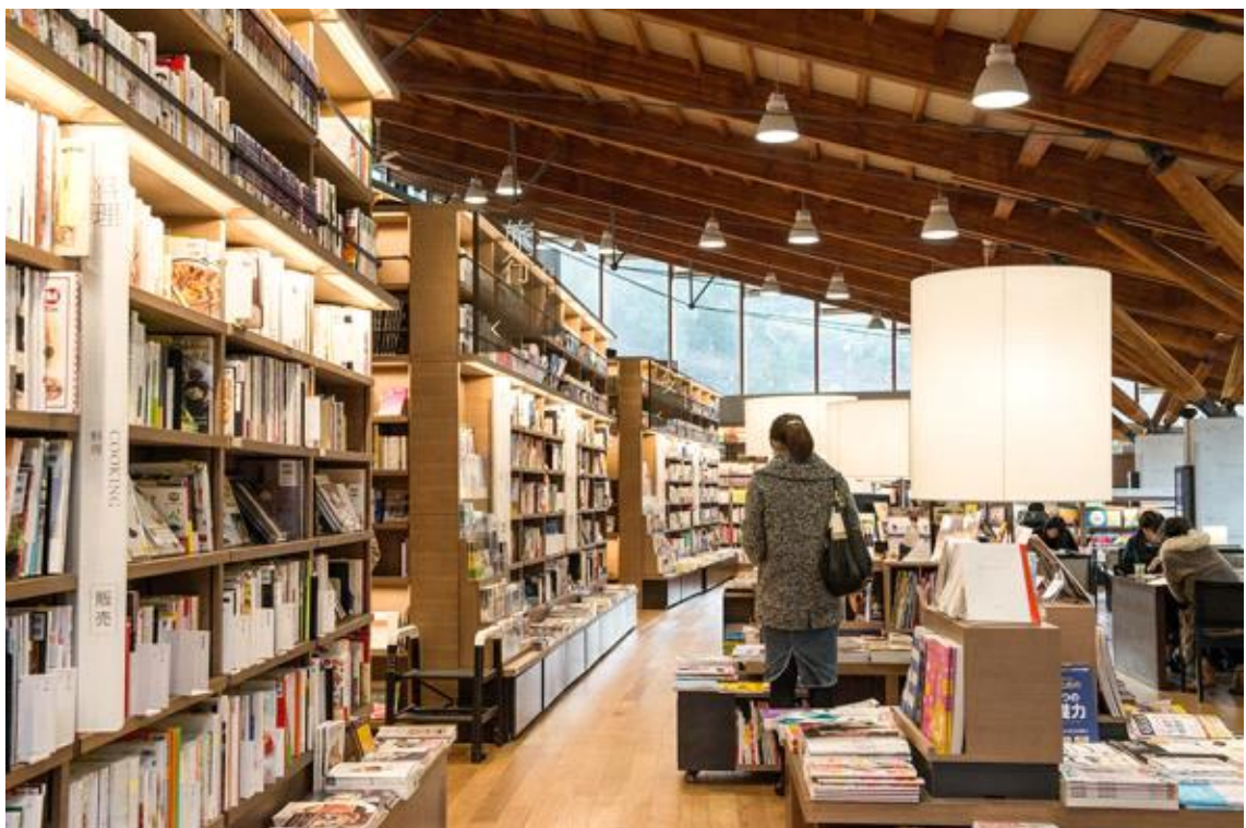
도서관 1층 전경