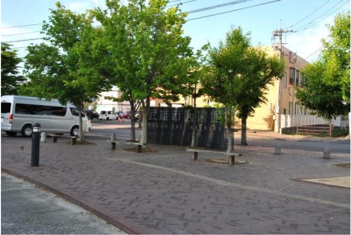
도서관 안내 사인