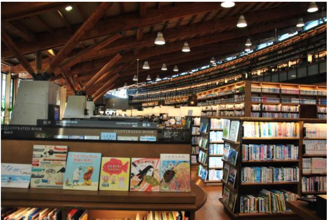
도서관 1층 내부