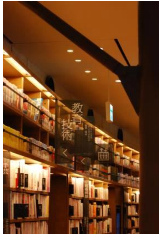
나무 모양의 기둥