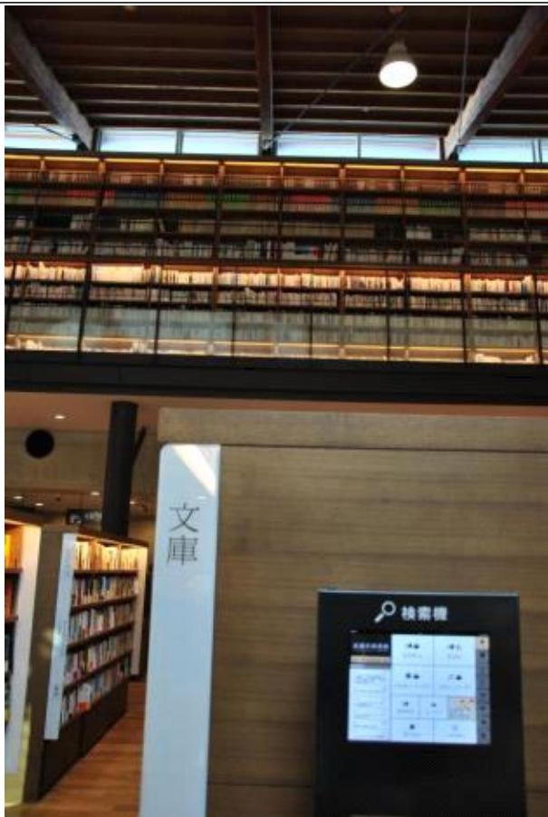
판매용 공간을 보여주는 흰색사인