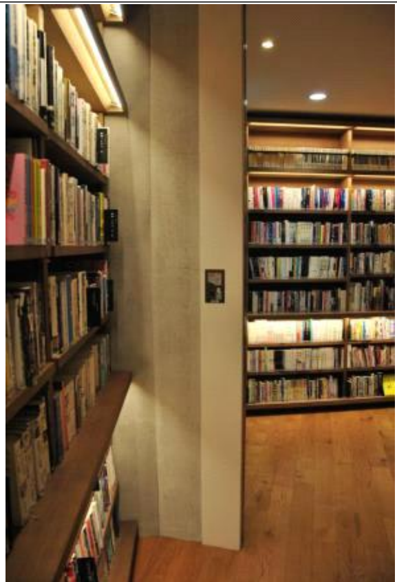
도서관 1층 내부