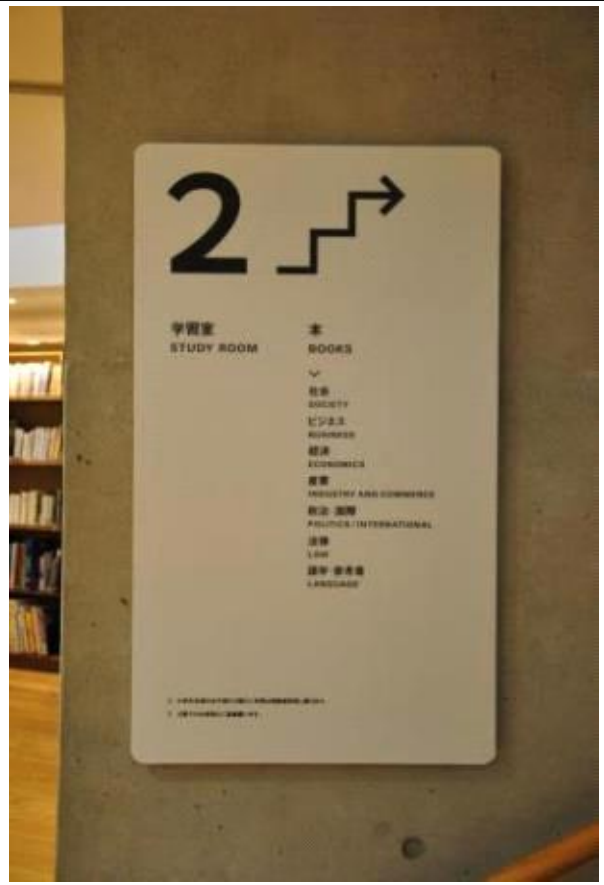
2층 안내 사인