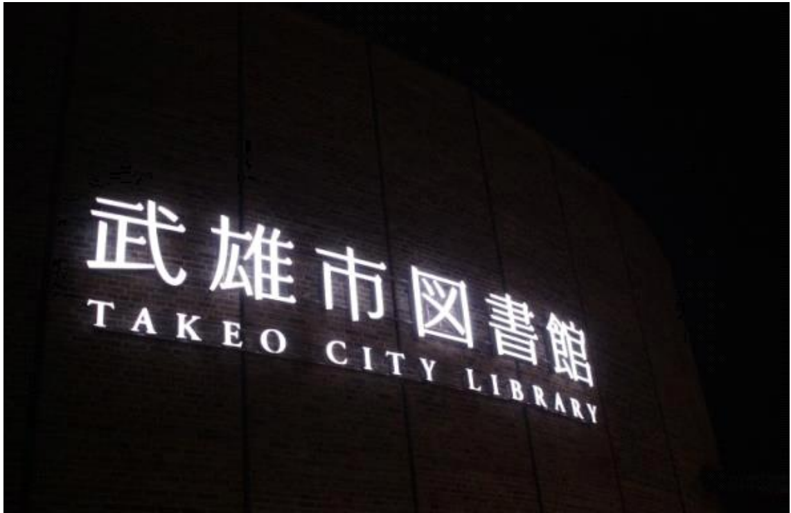
도서관 사인 야간