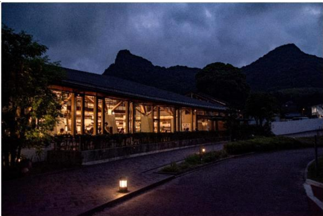
도서관 전경 야간