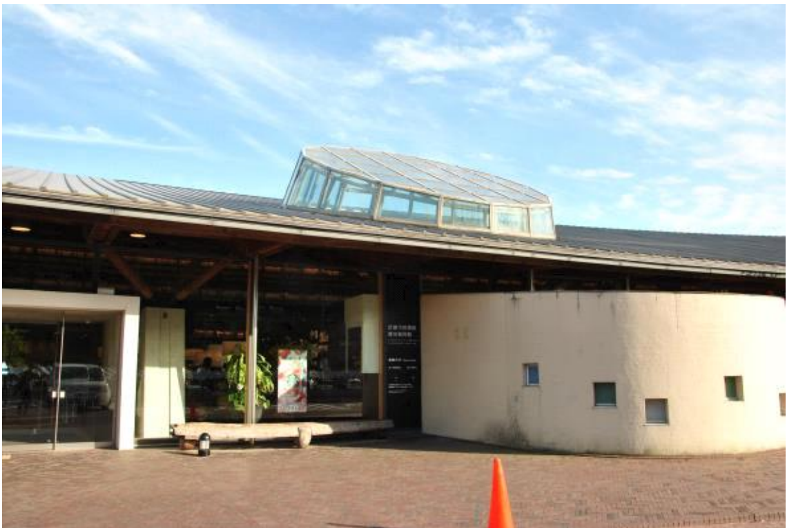
도서관 옆 휴식 공간