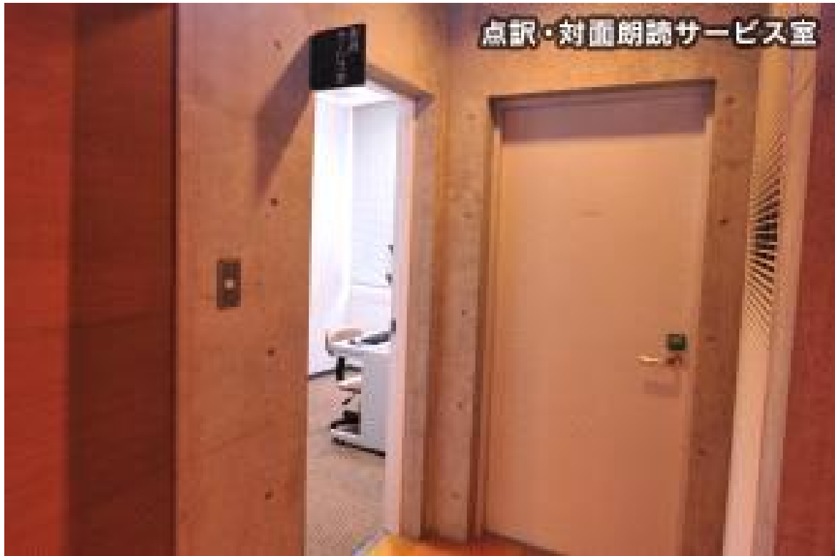
점역 대면 낭독서비스실