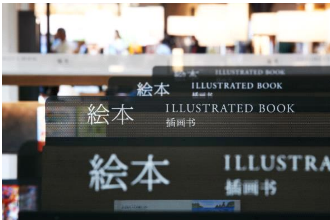
도서 분류 사인