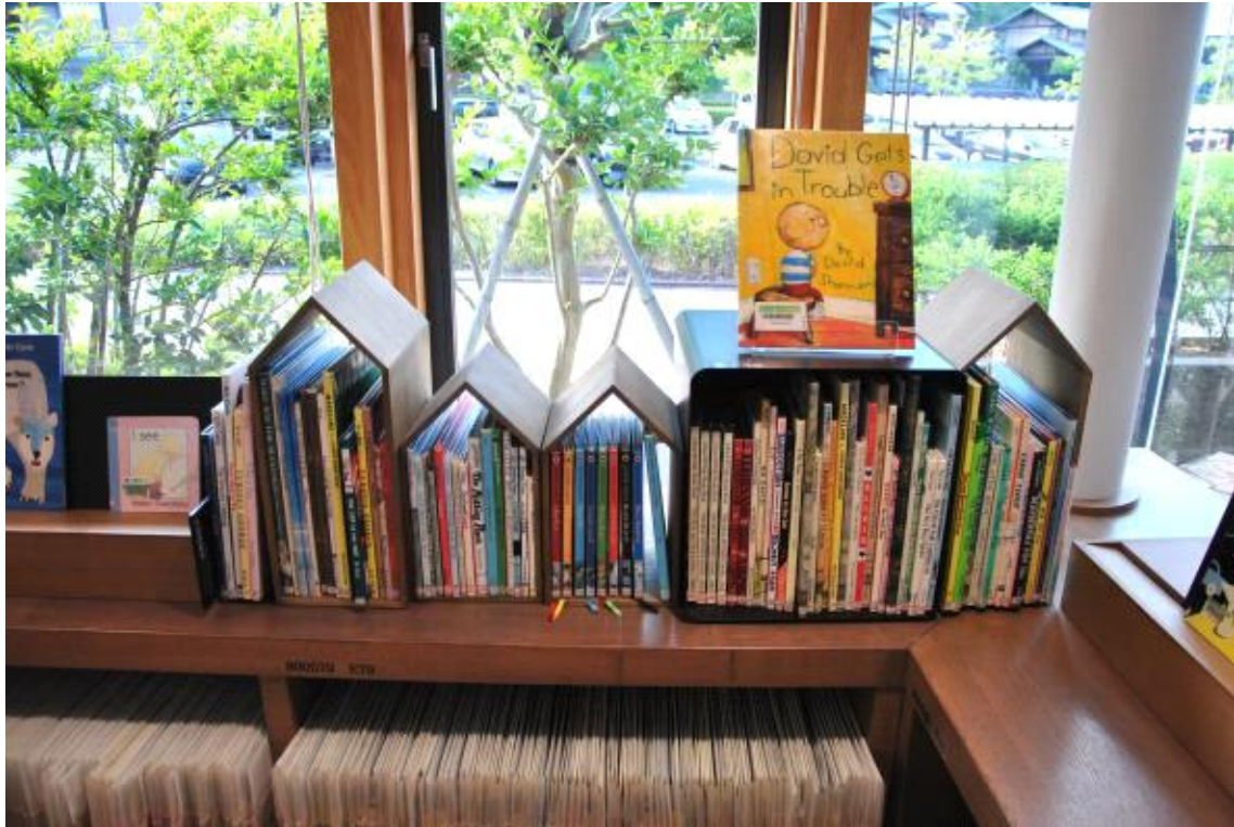
아동 도서 코너