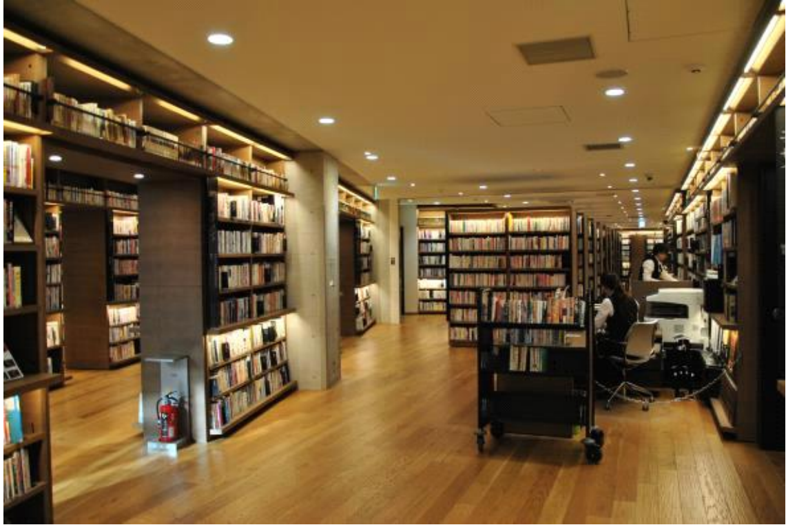
서가를 활용한 공간 구획