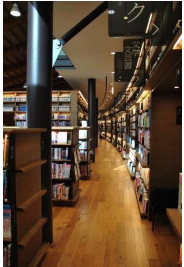
도서관 1층 내부