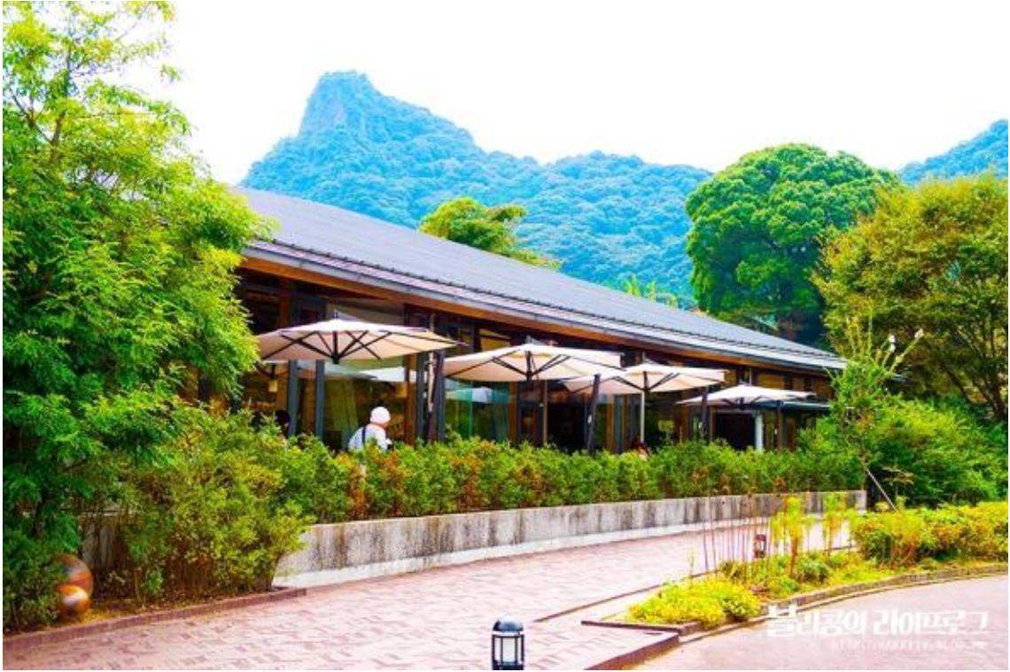
도서관 외부 테라스