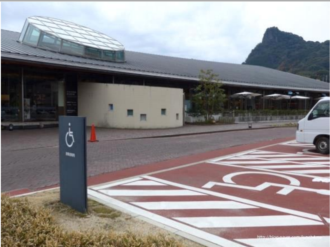
장애인 주차 구역