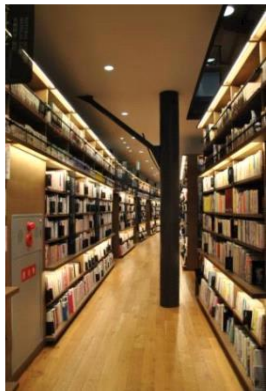
나뭇가지 형태의 기둥