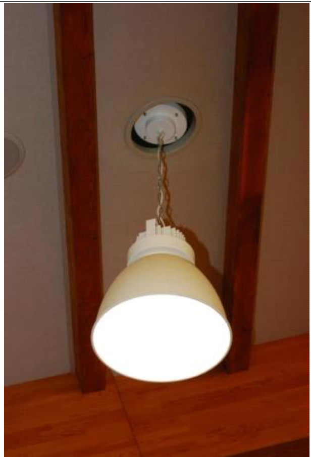
조명 설치 디테일