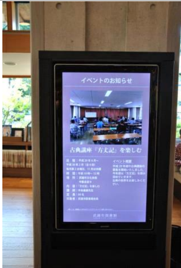
터치스크린을 통한 정보 확인