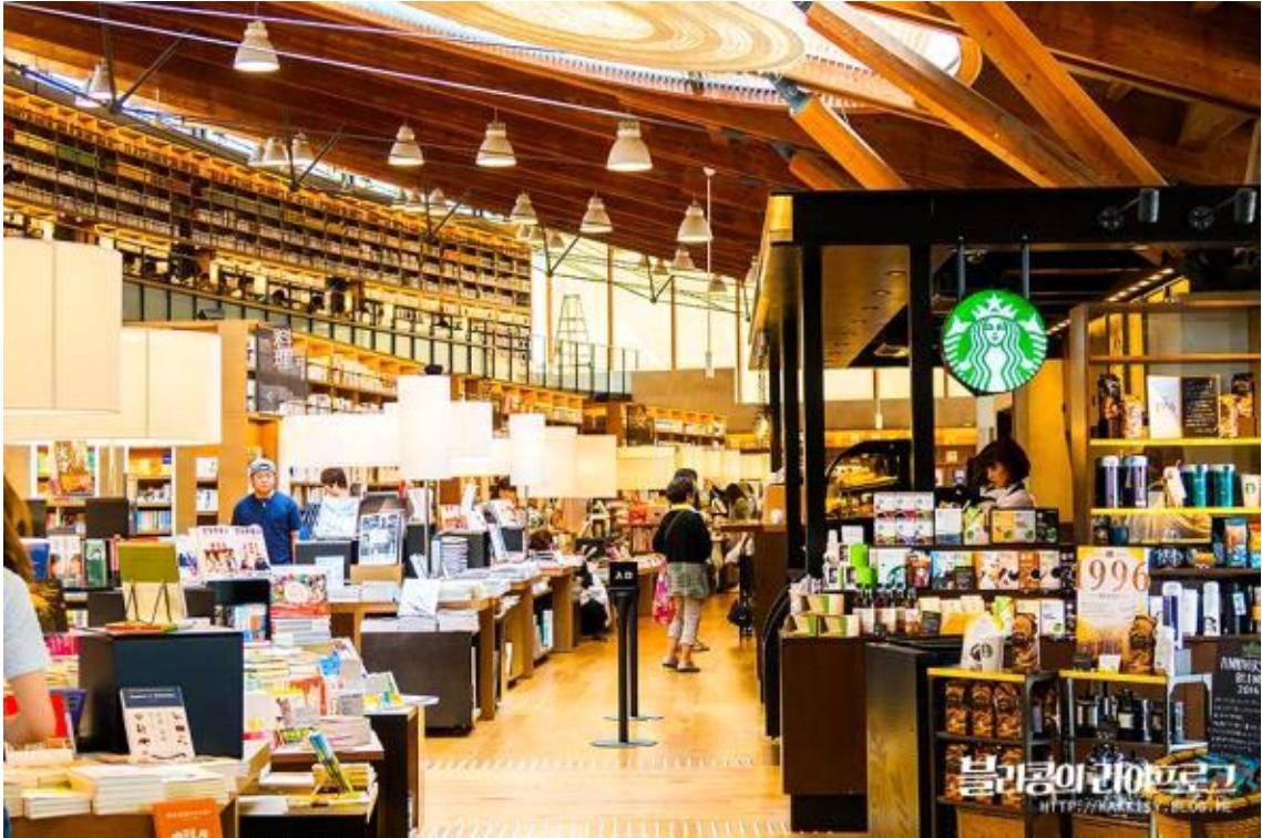
도서관 1층 스타벅스 존