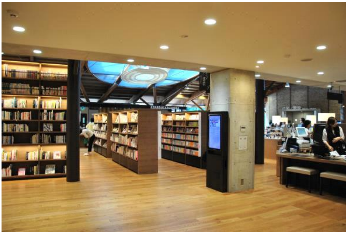
카운터 주변 모습