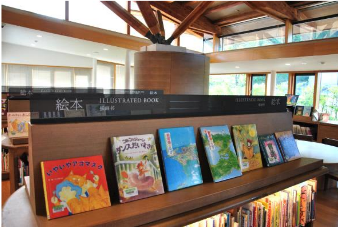
아동 도서 코너