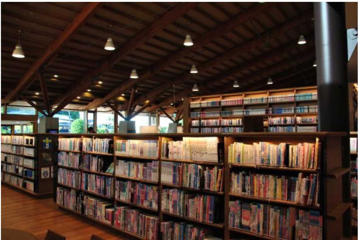
도서관 1층 내부