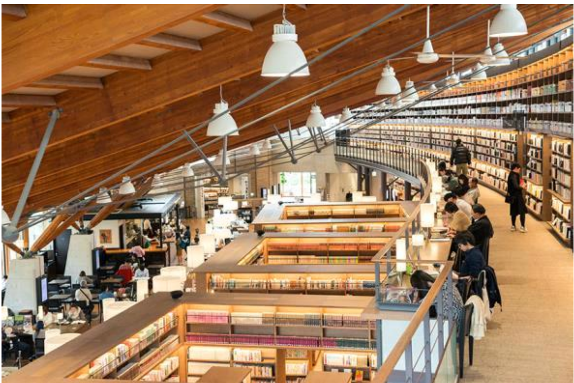
도서관 2층 전경