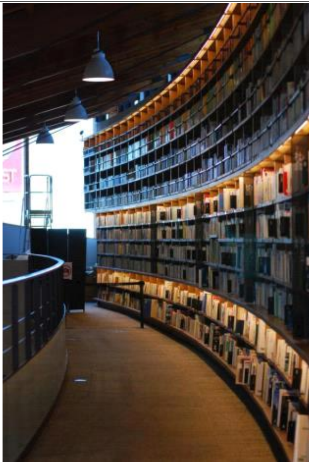
2층 라운드형 서가