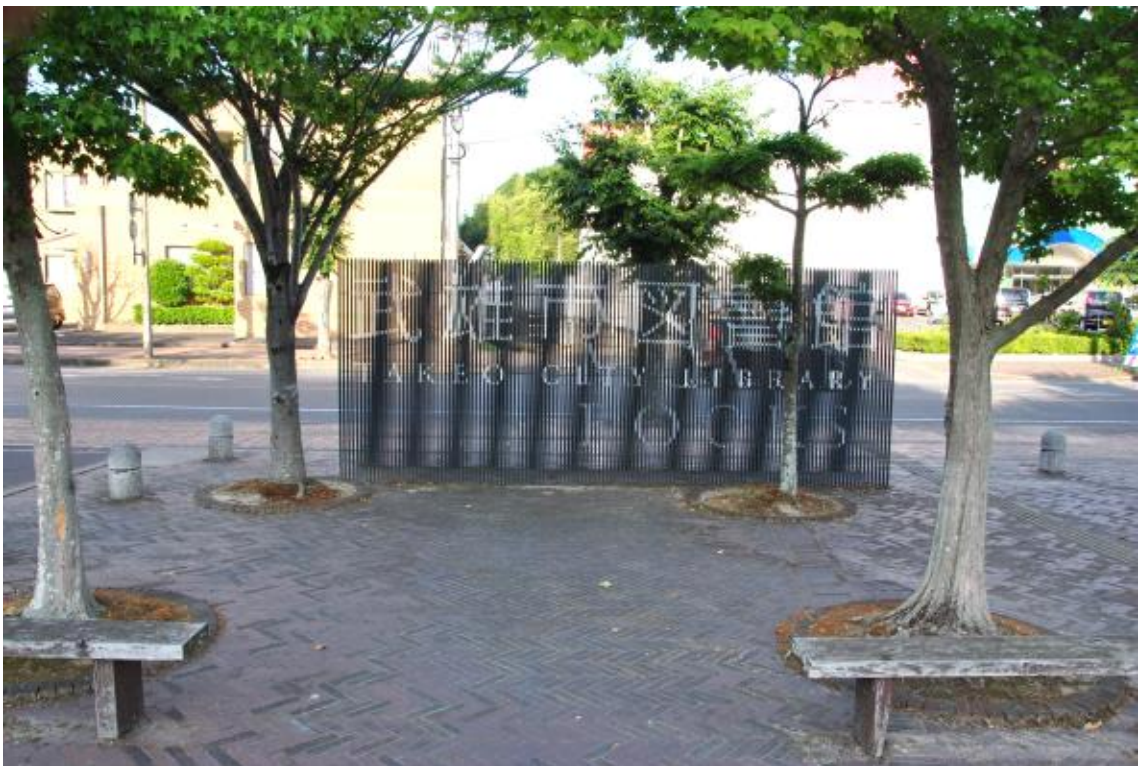
도서관 안내 사인