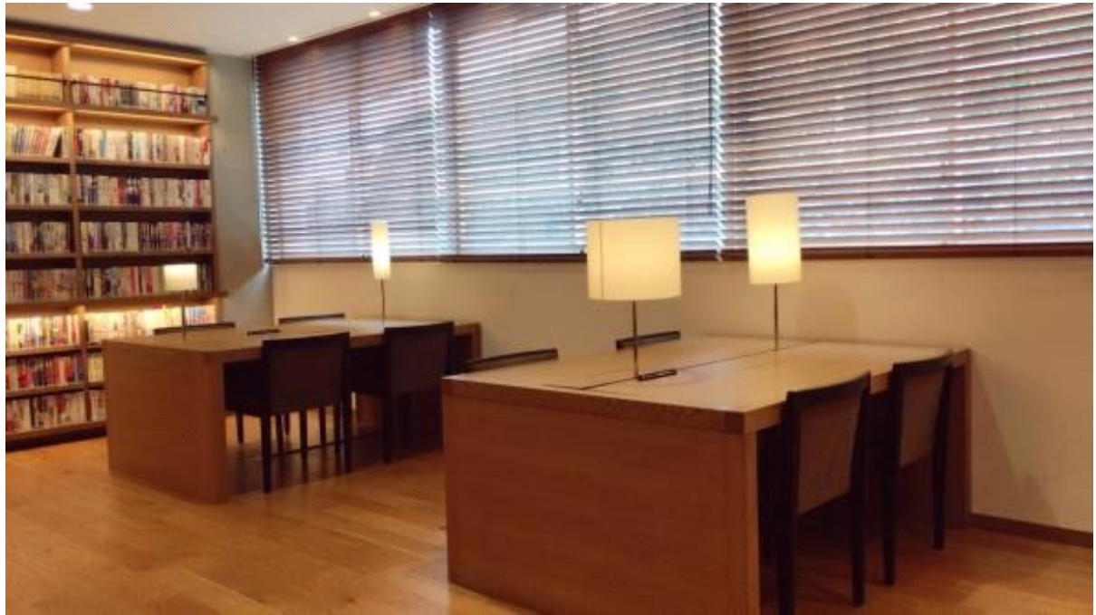
레인이 달려 있는 스탠드