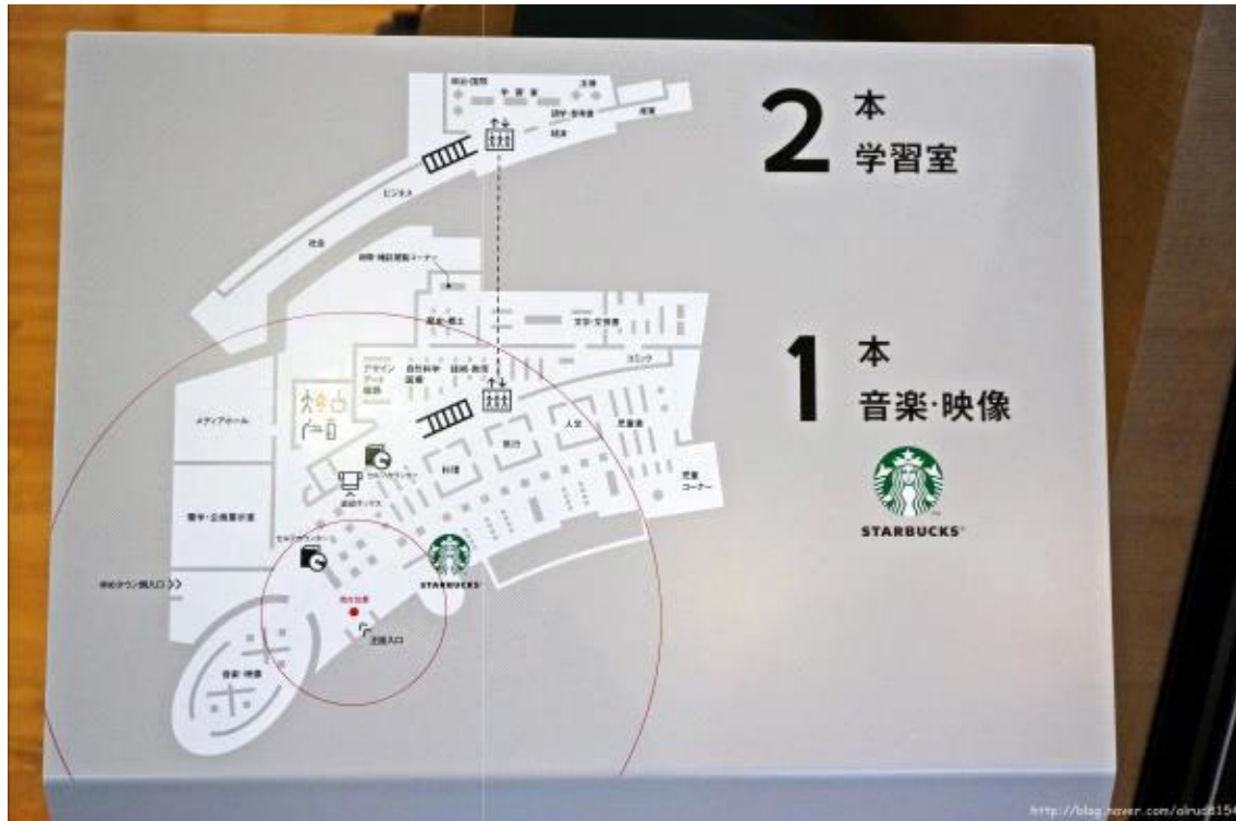
층 안내 사인