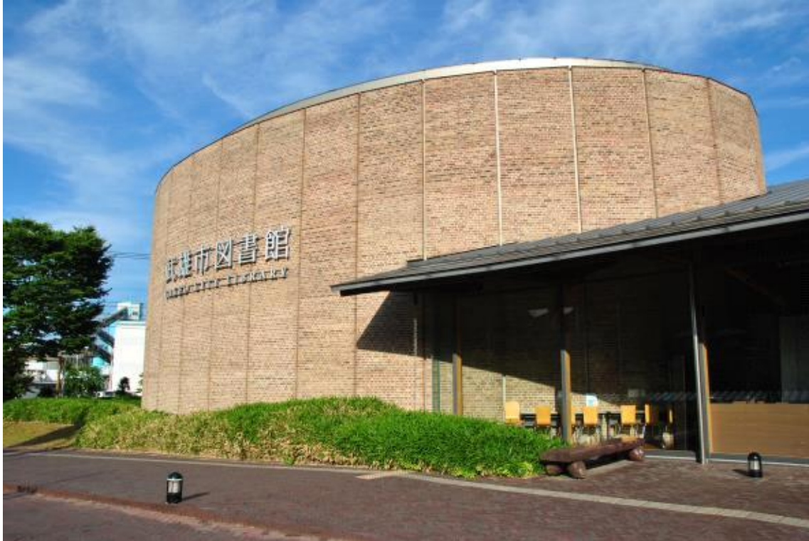
도서관 입구 전경