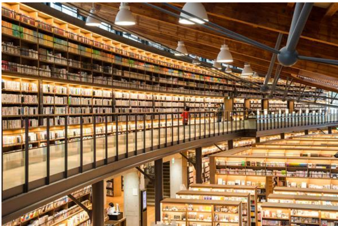
2층 라운드형 서가