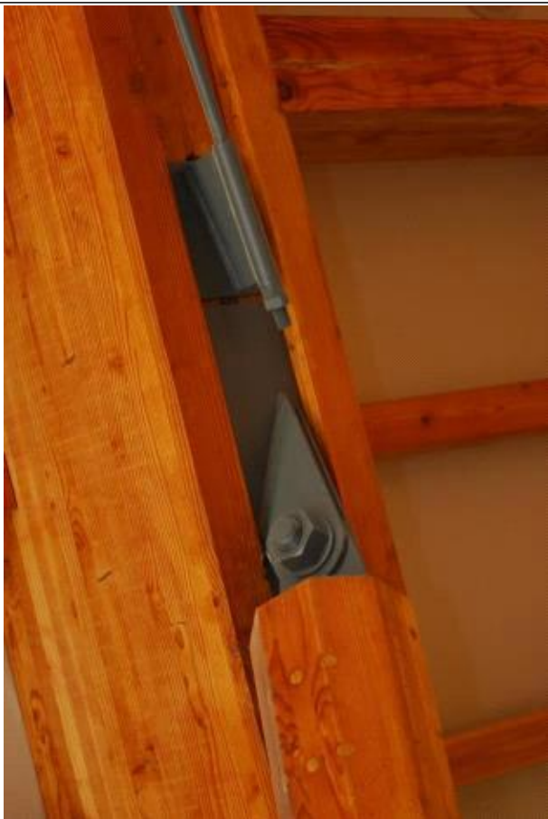
구조 접합부 디테일