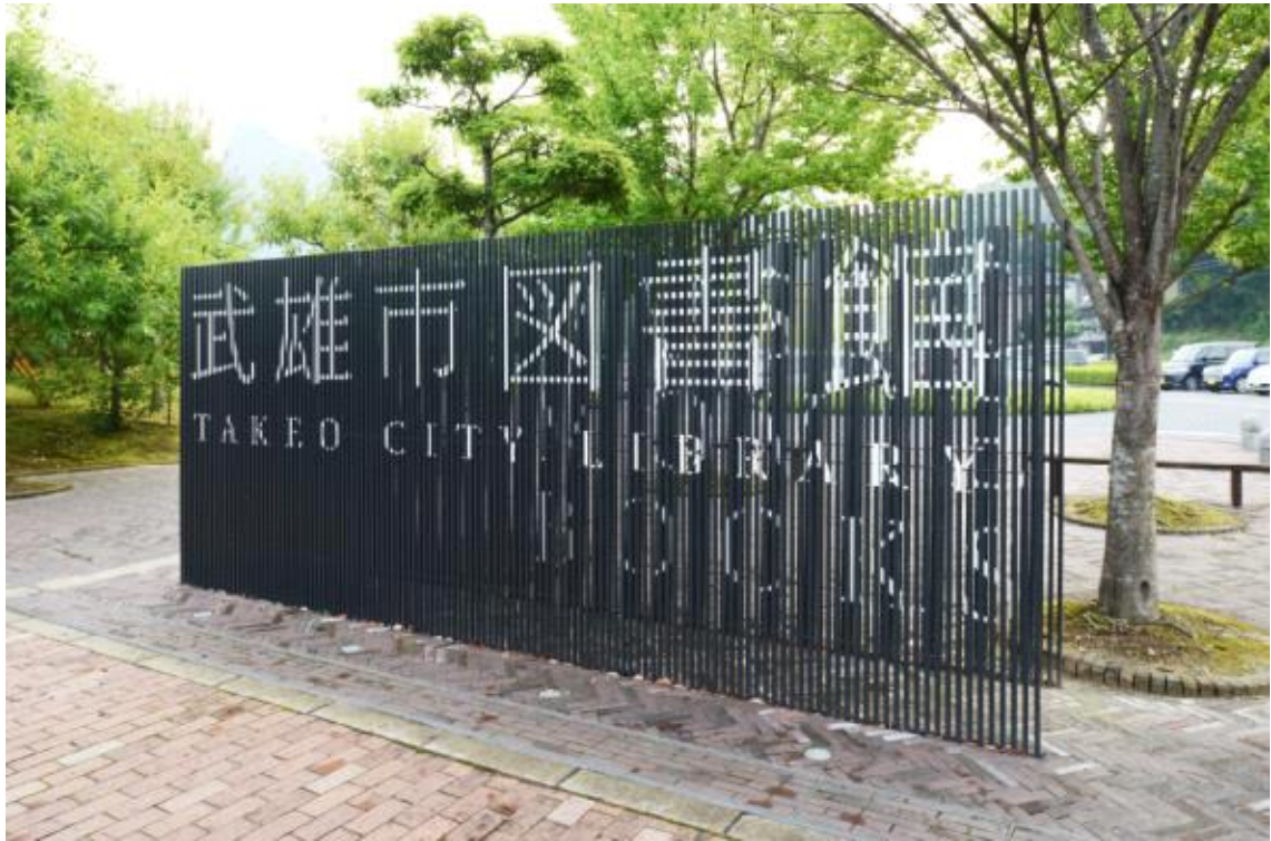
도서관 안내 사인