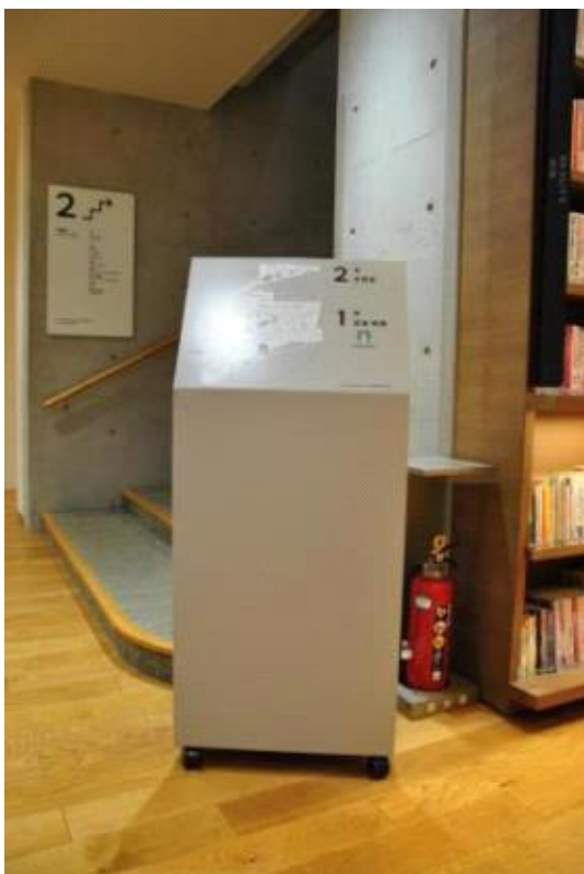
벽부형, 스탠드형 안내 사인