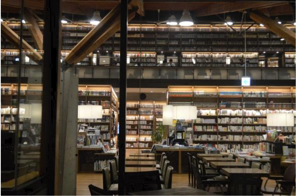
외부에서 본 도서관 내부