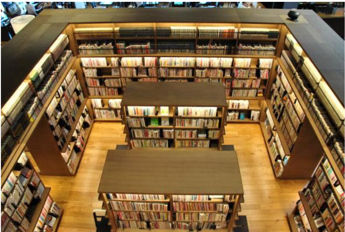
2층에서 본 1층 서가