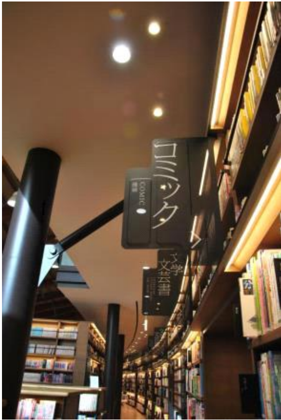
대출 도서 코너(검정색 사인)