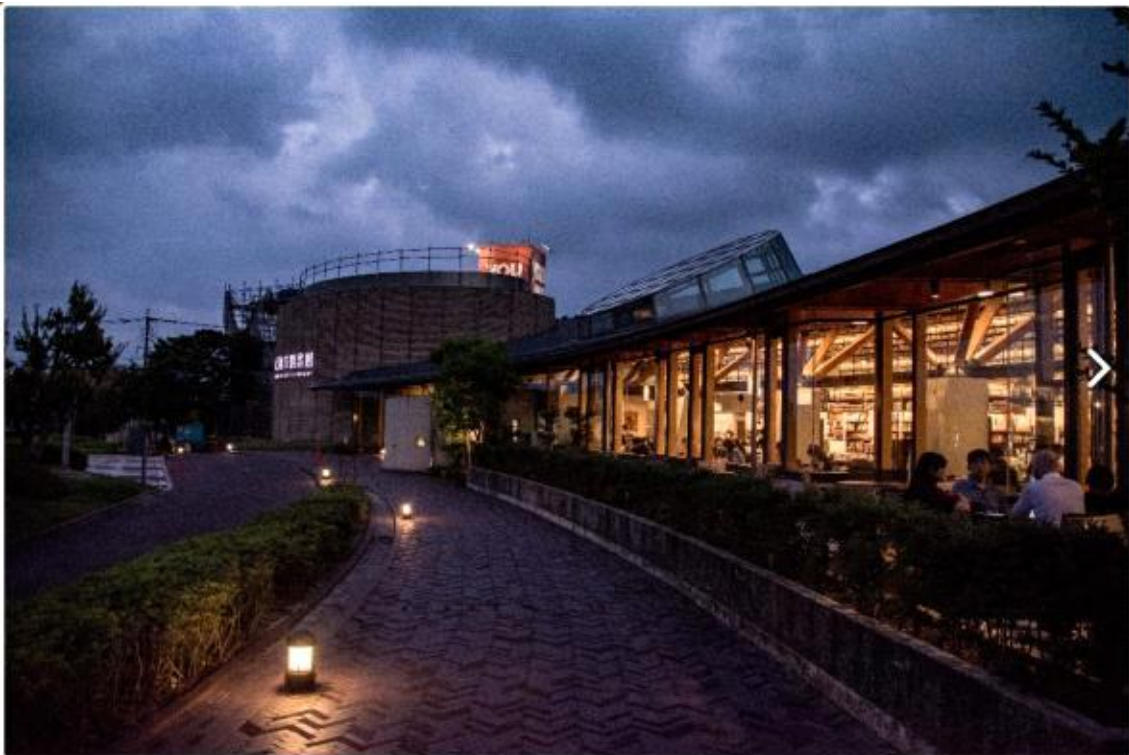
도서관 전경 야간