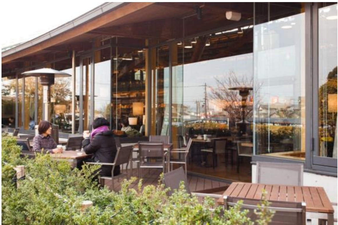
도서관 외부 테라스