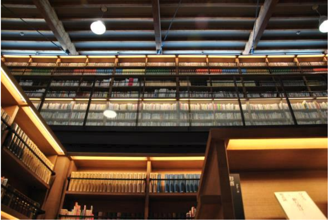
1층에서 바라본 2층 서가