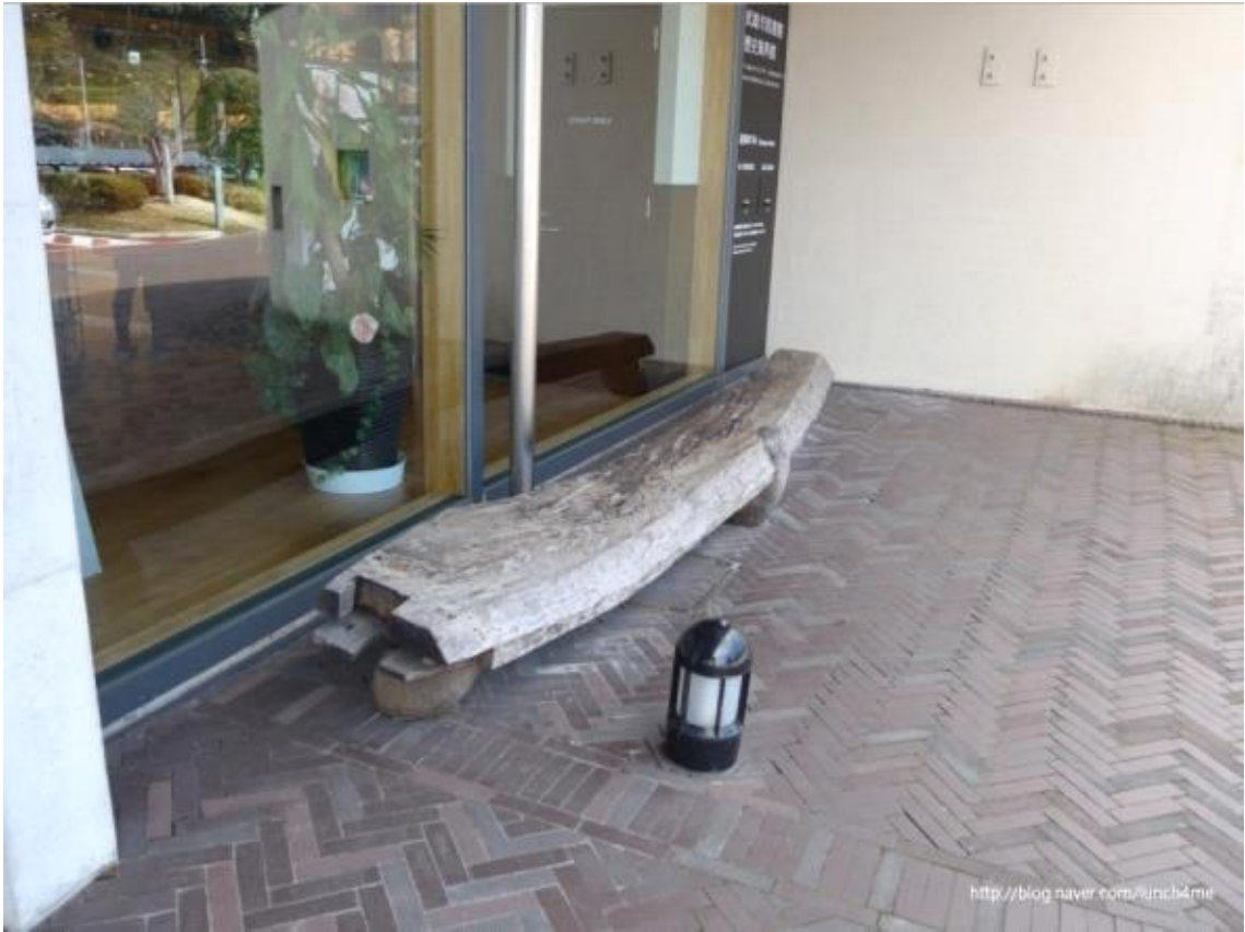
도서관 입구 벤치