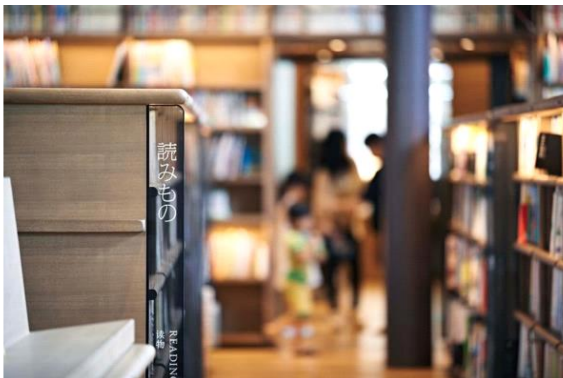
도서 분류 사인