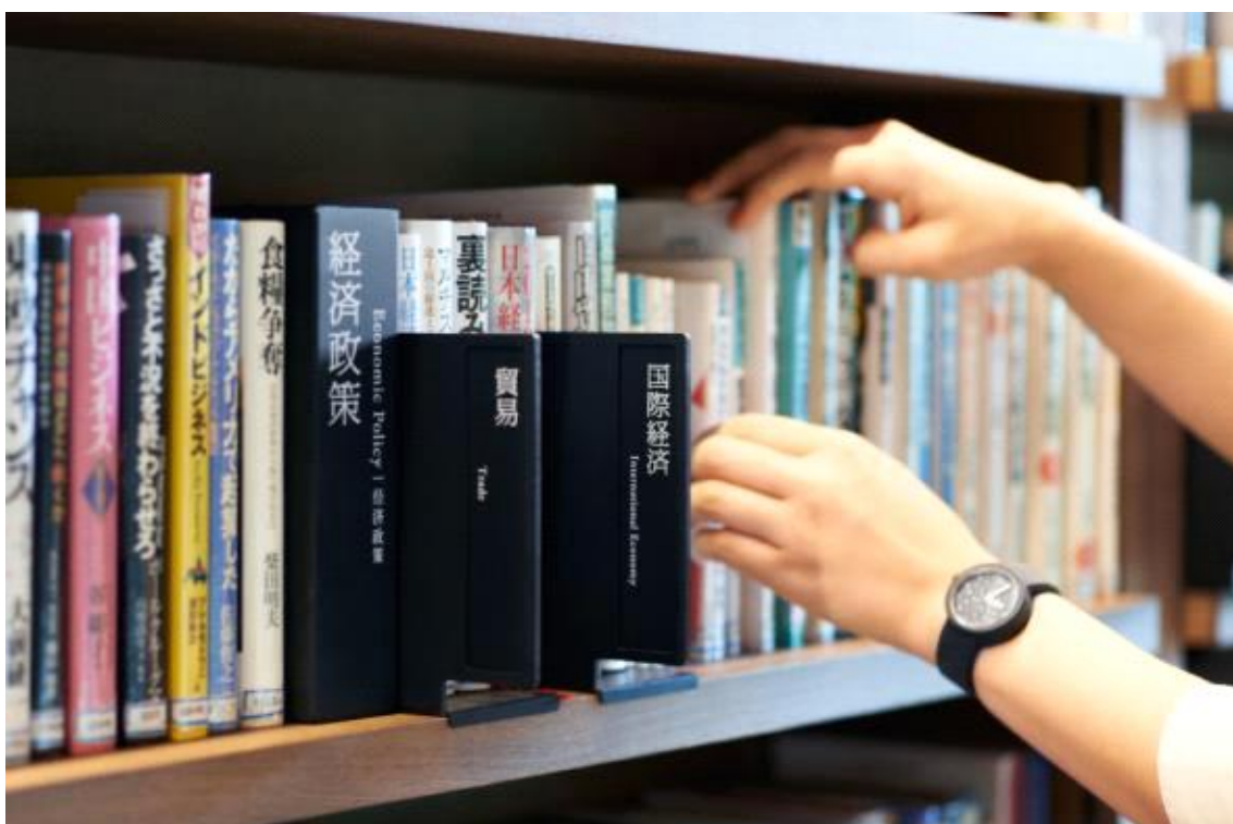
도서 분류 사인