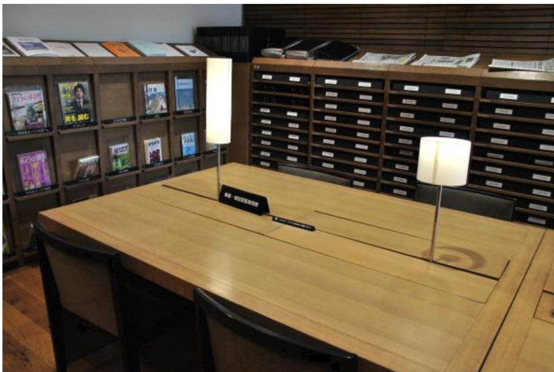
두 가지 종류의 스탠드 램프