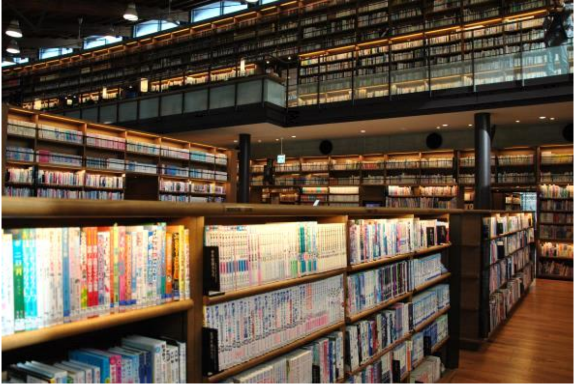
도서관 1층 내부