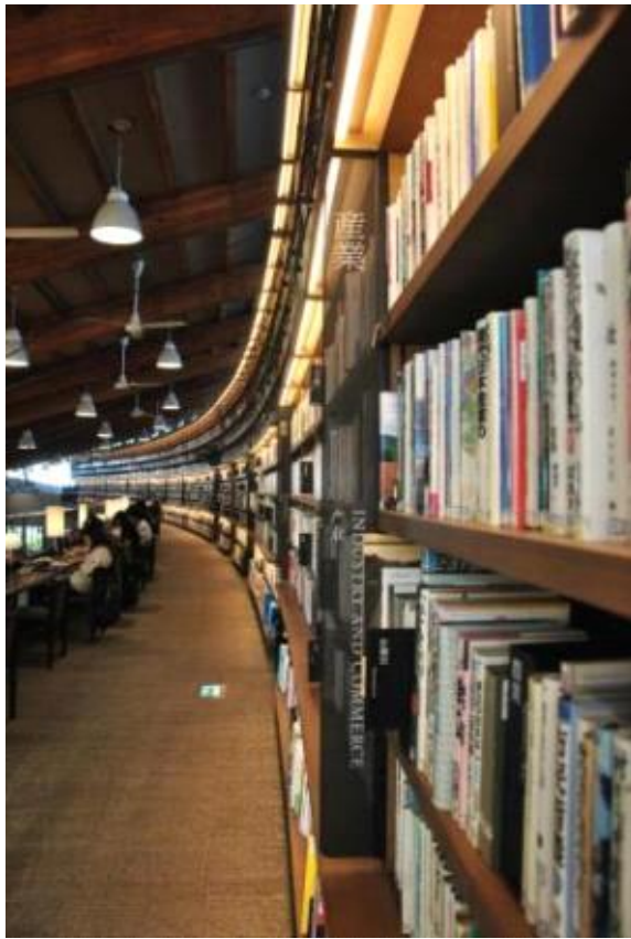
라운드형 2층 서가