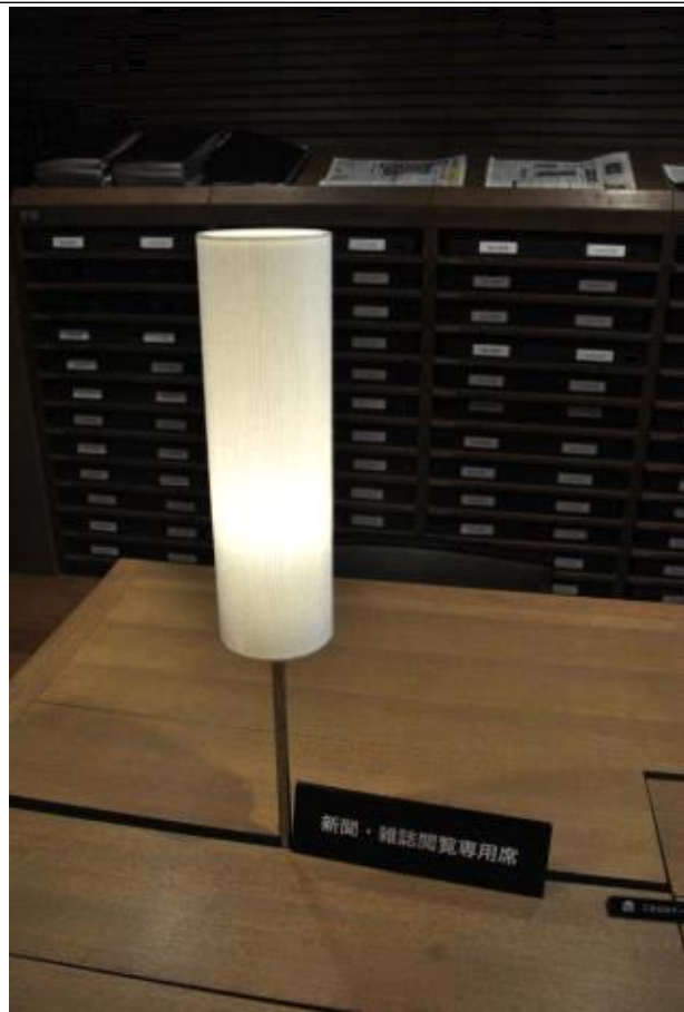
스탠드 램프 디테일