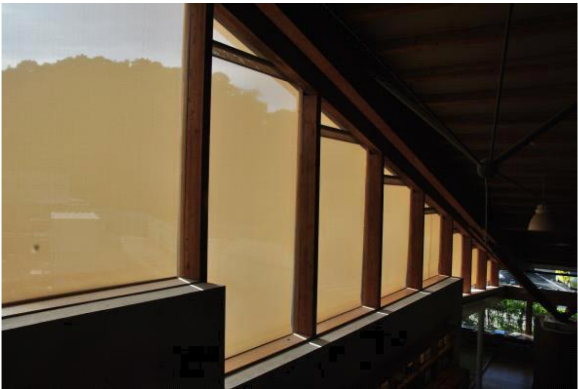
2층 창가 디테일