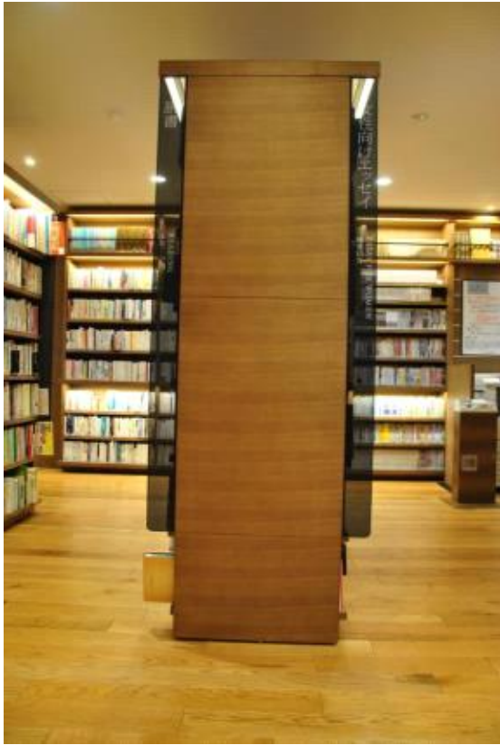
책장 및 분류 사인