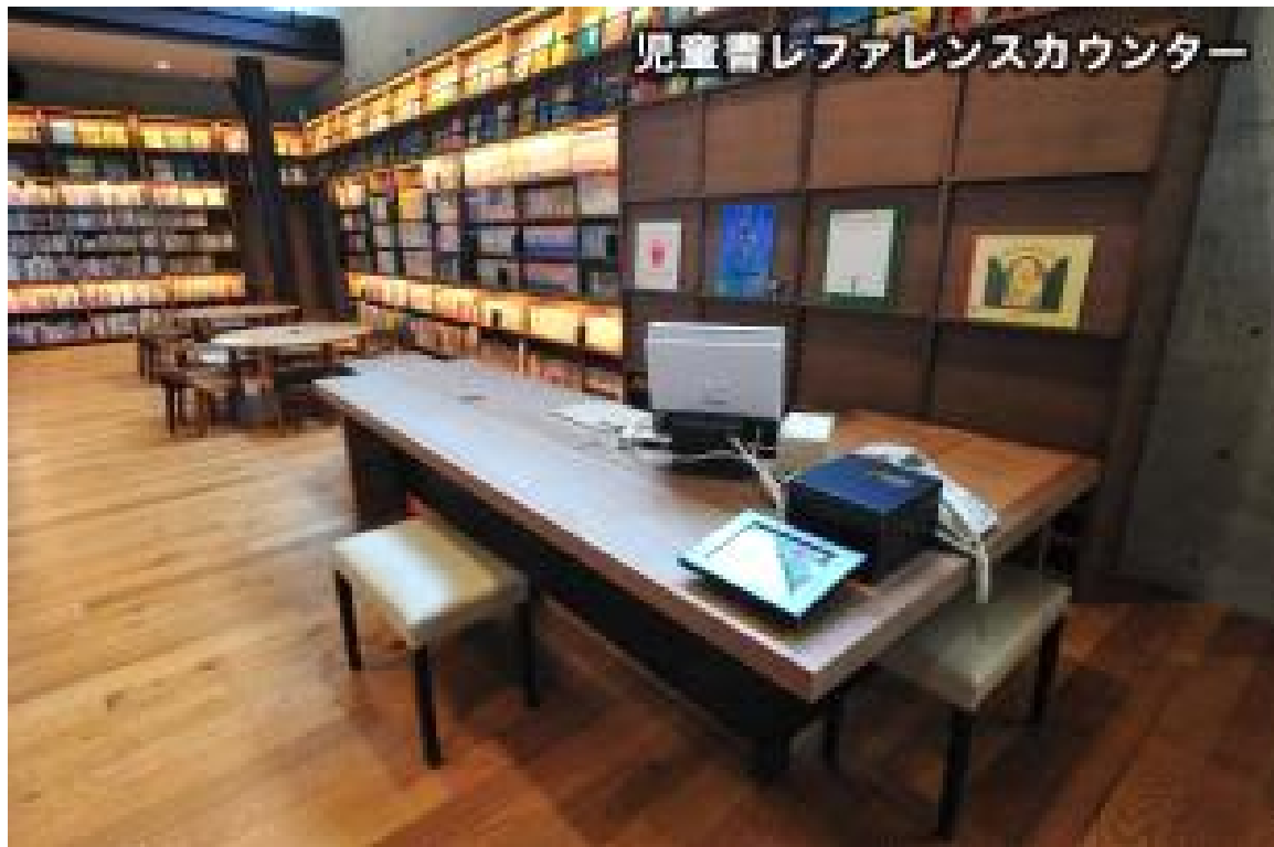
아동서 레퍼런스 카운터