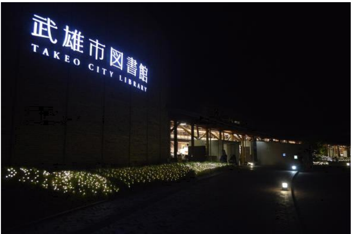
도서관 전경 야간