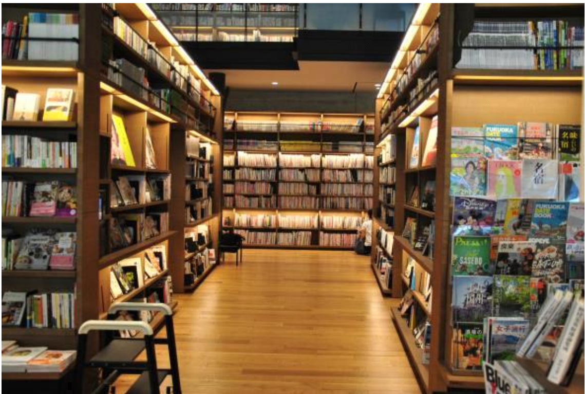
도서관 1층 내부