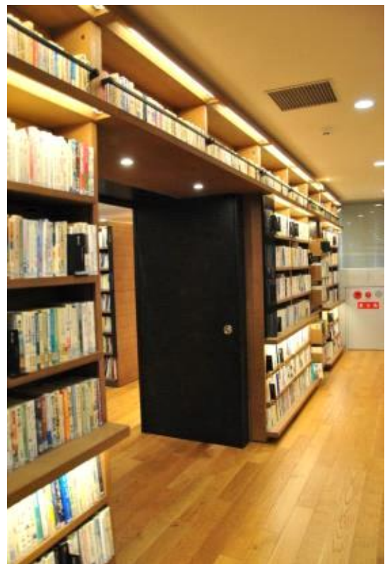
벽체를 활용한 서가