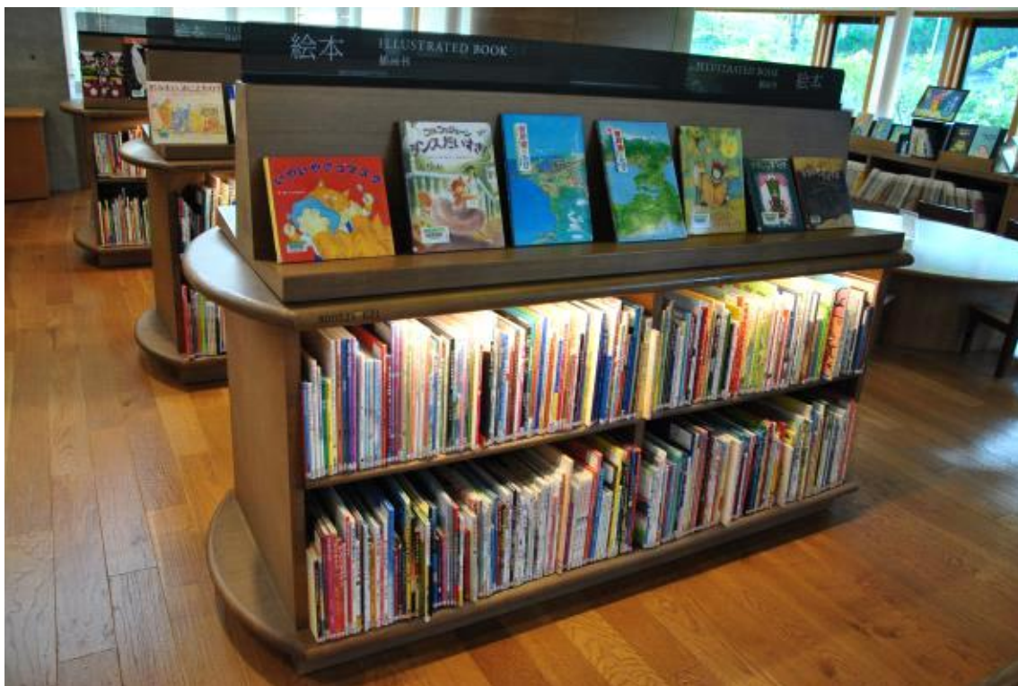
아동 도서 코너