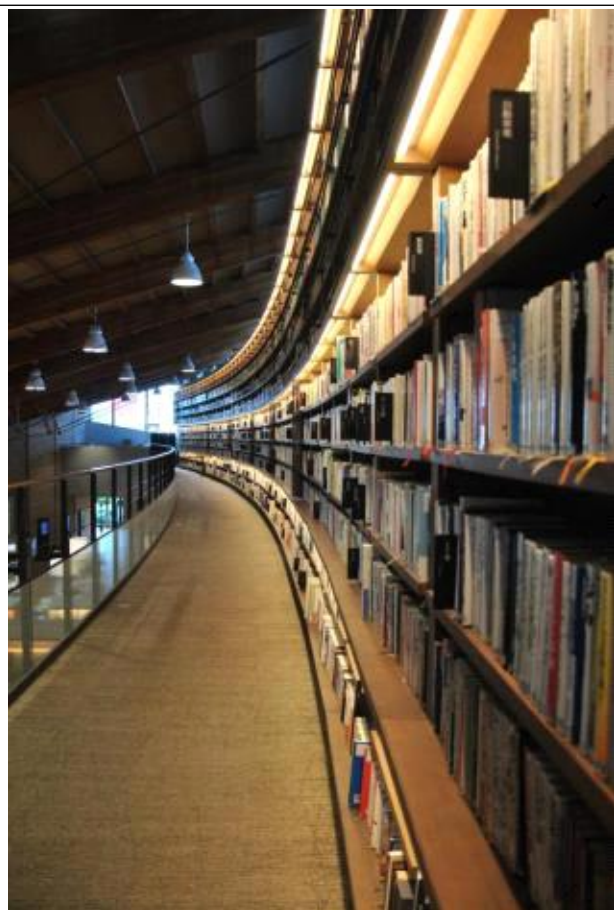
라운드형 2층 서가