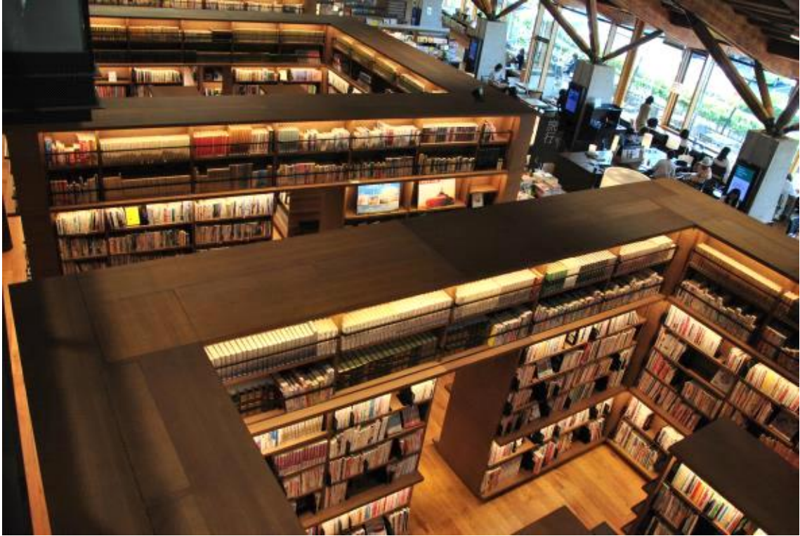
2층에서 본 1층 서가