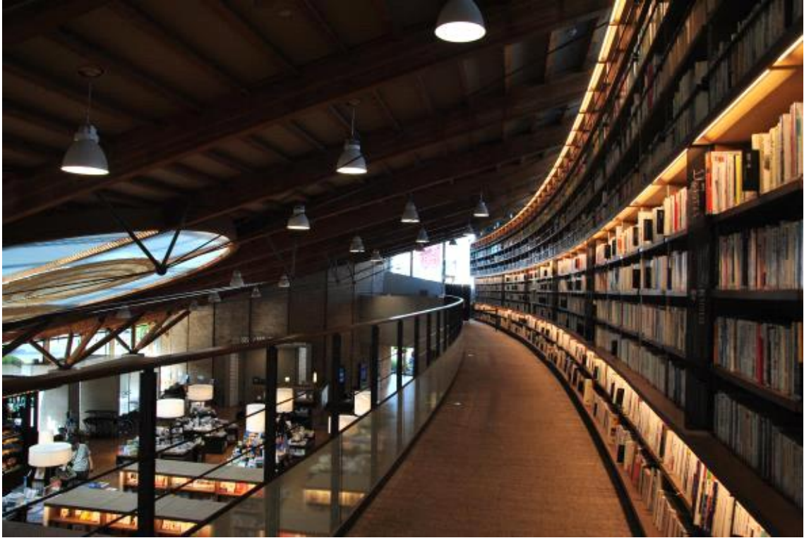
도서관 2층 내부