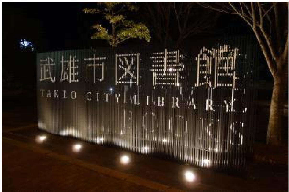
도서관 안내 사인 야간