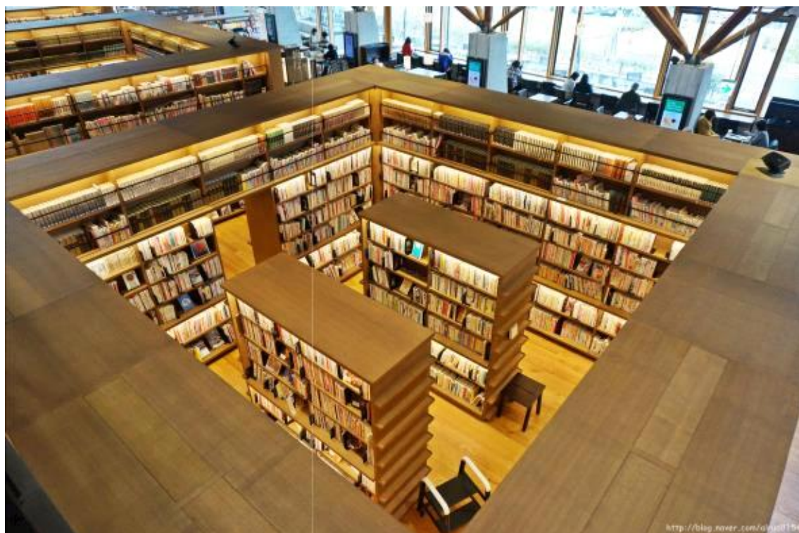
모자 모양의 서가