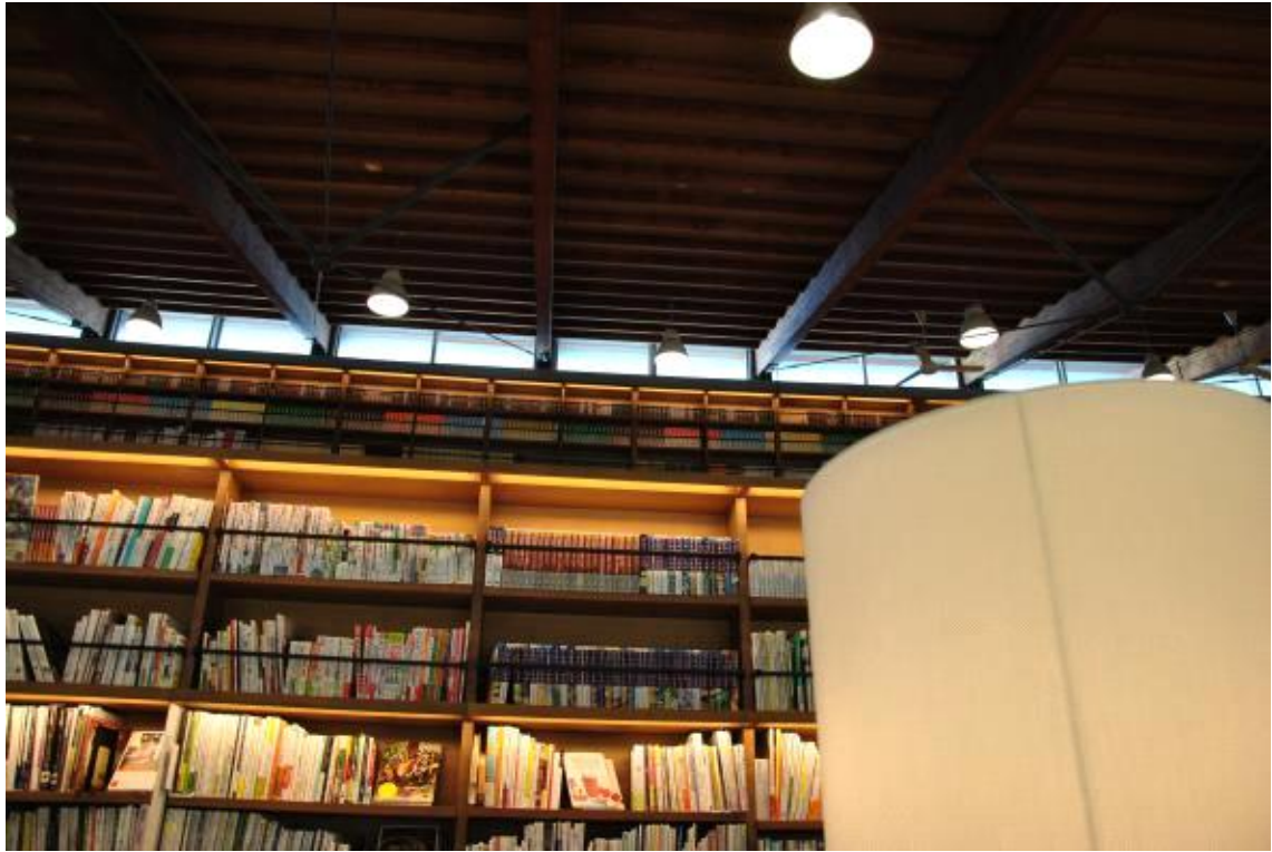
1층에서 바라본 2층 서가