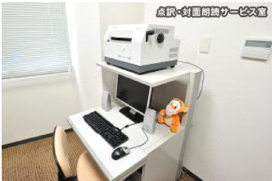
덤역 대면 낭독서비스실