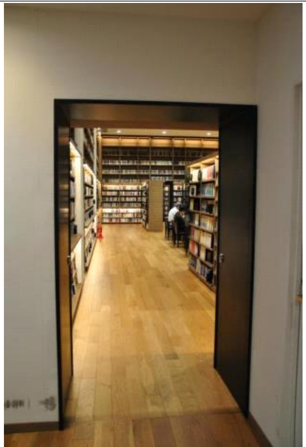
도서관 1층 내부