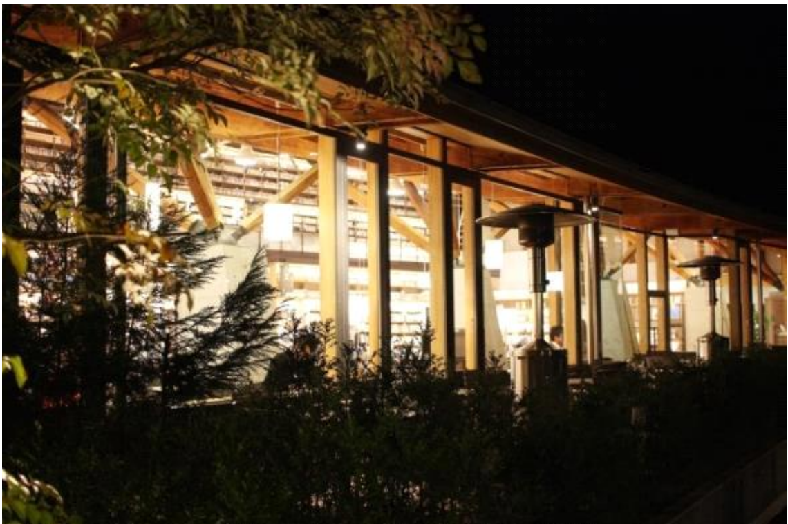
도서관 야외 테라스 야간